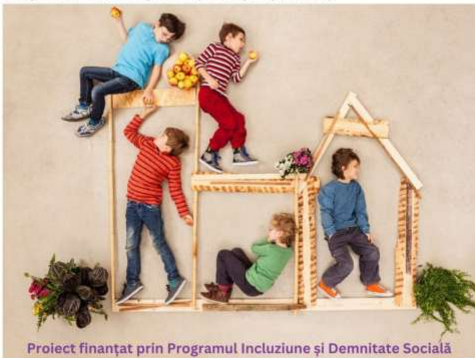
Proiect finanțat prin Programul Incluziune și Demnitate Socială

Direcția Generală de Asistență Socială și Protecția Copilului Timiș